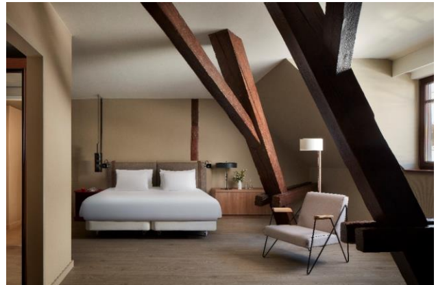
Das Hotel verfügt über 168 elegante Zimmer und Suiten.

Heidelberg verfügt über die älteste Universität Deutschlands und bildet ein wichtiges kulturelles Zentrum des Landes. Mit der barocken Altstadt und dem Schloss Heidelberg lockt das Baden-Württembergische Juwel jährlich 11,9 Millionen Besucher an. Die UNESCO hat Heidelberg sogar 2014 als „City of Literature“ ausgezeichnet. Literarische Veranstaltungen, Literaturfestivals und eine lebendige Autoren- und Theaterszene prägen die Stadt und ihr Flair.